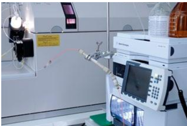
Kopplung der LC mit der ICP-MS zur Element-Spezies-Bestimmung

Sowohl die essentiellen als auch die toxischen Eigenschaften der Elemente hängen meistens von ihrer chemischen Bindungsform ab bzw. in welcher Spezies diese Elemente vorliegen. So haben z.B. sechswertige Chromverbindungen eine deutlich höhere Toxizität als die dreiwertigen Chrom-Spezies. Im Falle des Arsens sind die anorganischen Spezies eindeutig kanzerogen und stark toxisch verglichen mit dem viel weniger toxischen Arsenobetain. Gerade diese organisch gebundene Spezies kann jedoch nach Fischverzehr den Gesamt-Arsen-Gehalt im Urin signifikant erhöhen somit eine Intoxikation mit Arsen vortäuschen. In so einem Fall ist zur klinischen Diagnostik daher die quantitative Differenzierung der einzelnen Arsen-Spezies im Urin notwendig.