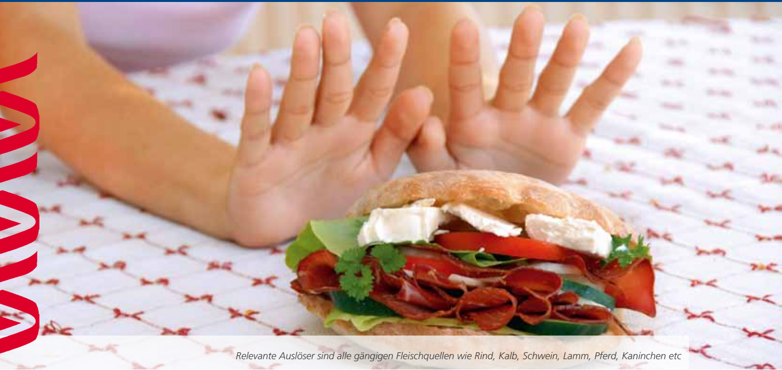
Relevante Auslöser sind alle gängigen Fleischquellen wie Rind, Kalb, Schwein, Lamm, Pferd, Kaninchen etc