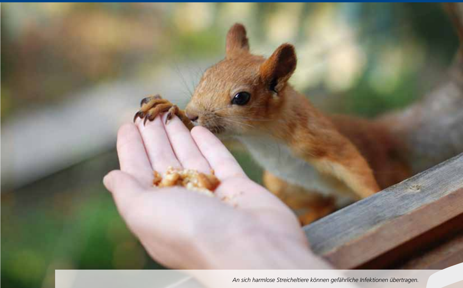
An sich harmlose Streichtiere können gefährliche Infektionen übertragen.